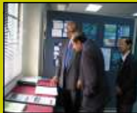
Pemeriksaan hasil kerja pelajar

Kepada KJ dan pensyarah-pensyarah jabatan: Diharapkan akan terus mengharumkan nama fakulti di masa-masa akan datang.