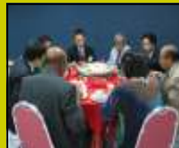
Sesi menjamu selera