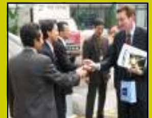
Semoga kerjasama terjalin erat